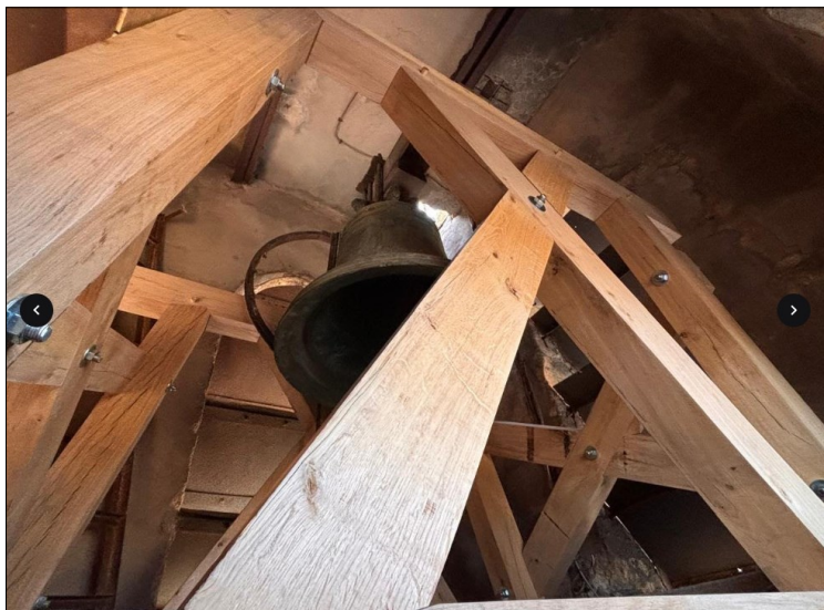
Le beffroi terminé et la cloche reposée.